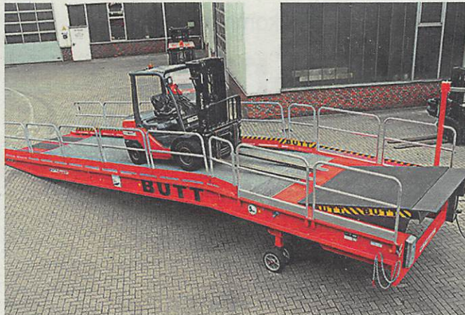
Mobile Verladerampe mit elektrohydraulischer Vorschubbrücke für leichtes Andocken an den Lkw.